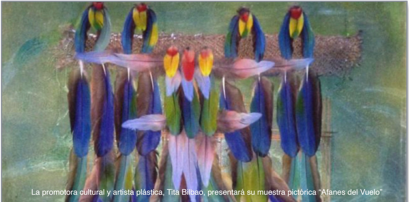
La promotora cultural y artista plástica, Tita Bilbao, presentará su muestra pictórica "Afanos del Vuelo"

A partir de agosto del 2018, radica en la ciudad de Chihuahua, Chh., continúa con su trabajo artístico y con el espacio de Tiempo de Oficios, desde donde desarrolla actividades artísticas, educativas y de promoción cultural.