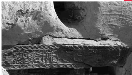
ICOMOS four international scientific committees on Vernacular Architecture, Earthen Architectural Heritage, Wood Architecture Heritage and Energy, Sustainability and Climate change are jointly organizing the international conference on 'Earthen and wood vernacular heritage and climate change' under the patronage of ICOMOS Sweden.