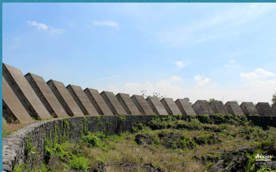
Espacio Escultórico CU https://www.mexicoalternativounam.com/delegacion/26

Sin embargo, éstos dos conceptos ya están incorporados en la Ley Federal del Patrimonio Cultural el patrimonio material e inmaterial, pero es una complicación muy fuerte por la forma en la que