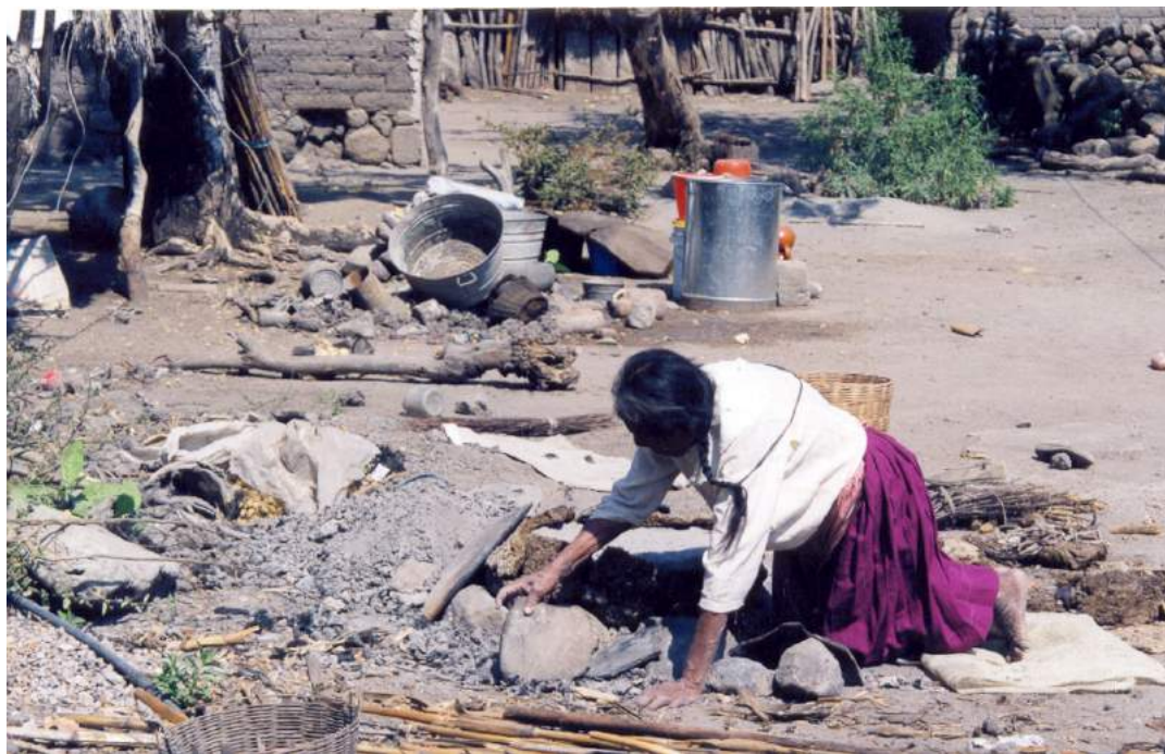
Evidencia material de la producción cerámica en el registro etnográfico de una comunidad alfarera en el Estado de Morelos, México.

"No tenemos metodologías claras para poder defender las herencias sociales de todas estas comunidades".