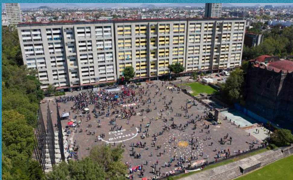
Fotografía Tlatelolco

Lamentablemente, parte del mandato federal del INAH radica en dar a conocer el valor social de su espacio. Y es que ese valor social del patrimonio, no radica en la preocupación porque se trate de monumentos. Sin embargo, ha habido proyectos muy interesantes por parte del INAH en donde la creatividad de la forma como algunos investigadores han generado un proyecto de títeres alrededor de la zona de Teotihuacán, o han ido a las escuelas a contar la historia