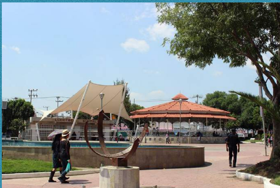
Jardín Municipal Hidalgo. Ixtapaluca, Estado de México, México. https://www.mexicoalternativounam.com/delegacion/16

GMB: Entonces ¿el programa tiene investigación, docencia y divulgación?