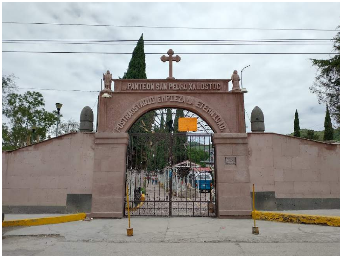
"Panteón de San Pedro Xalostoc"

GMB: Por supuesto, ya que estos patrones tienen que ver con la memoria colectiva, ya sea dicha o actuada en un discurso implícito, no dicho pero pendiente de ser relatado.