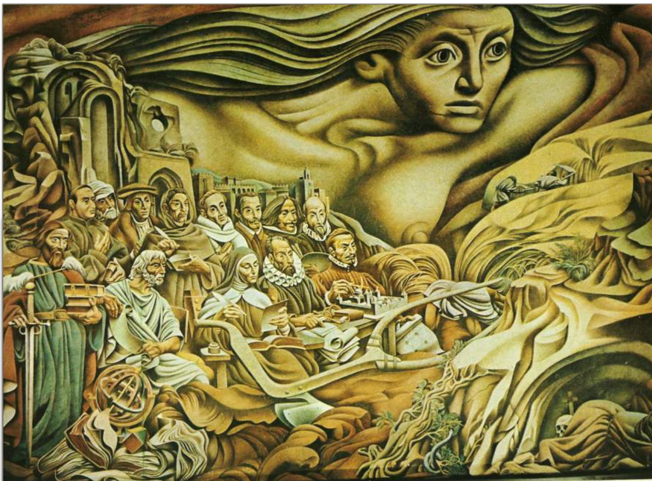
Mural de Josep Renau que lucía el Hotel Casino de la Selva, Cuernavaca, Morelos, México.