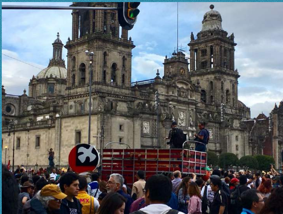
Centro de la Ciudad de México https://www.mexicoalternativounam.com/valor_social

GMB: Y es algo que estamos viendo con el proyecto del Tren Maya.