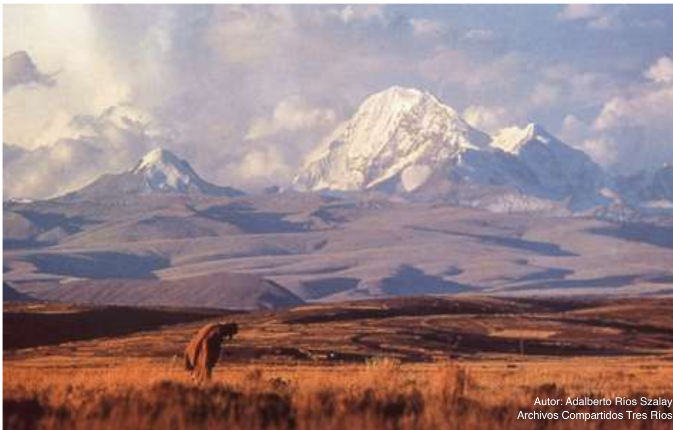
Autor: Adalberto Ríos Szalay Archivos Compartidos Tres Ríos

Para efecto de definir contenidos de rutas e itinerarios, me parece fundamental escuchar a quienes son sus herederos y protagonistas, porque se trata de una manera de cerrar el círculo y retroalimentar el proceso. Las observaciones externas a las que hemos estado acostumbrados son de utilidad, pero una las motivaciones fundamentales, si no la más importante que ha impulsado esta experiencia, es aportar a procesos internos de reflexión y desarrollo cultural, es decir escuchar y aprender “del otro”, manera de percatarnos que la pregunta antropológica tiene una gran respuesta: el otro somos nosotros. Todo ejercicio de Antropología visual debería ser evaluado.