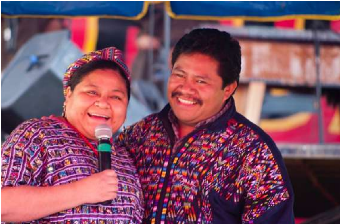
Autor: Adalberto Rios Szalay Archivos Compartidos Tres Rios

Pero por otro lado estamos viviendo una época de tinieblas en las que infortunadamente en lugar de que fueran los especialistas, los estudiosos, las comunidades, etc. los que determinaron estas cosas, han sido los políticos que meten sus pezuñas -porque no merecen otro término- y han destrozado cosas fantásticas, dices tú efectivamente el sismo nos debió de haber puesto a hacer muchas cosas.