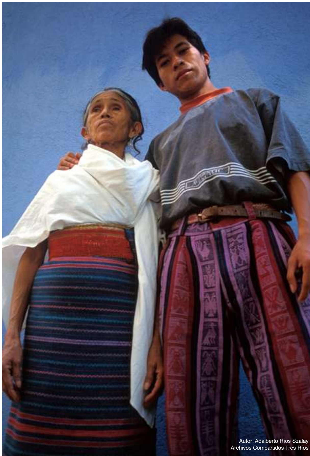
Autor: Adalberto Ríos Szalay Archivos Compartidos Tres Ríos