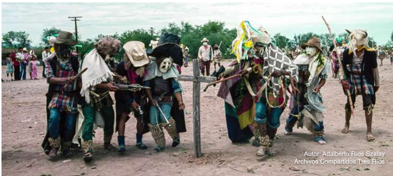
Autor: Adalberto Ríos Szalay Archivos Compartidos Tres Ríos

Preservar la riqueza de la heterogeneidad, al interactuar y sumar, es el gran reto para el logro superior de la unidad en la diversidad, por regiones, naciones y aún la humanidad entera. Equivale a imaginar y construir el futuro con base en un pasado presente. Significa lealtad con los legados recibidos, al desarrollarlos y proyectarlos como simiente del porvenir.