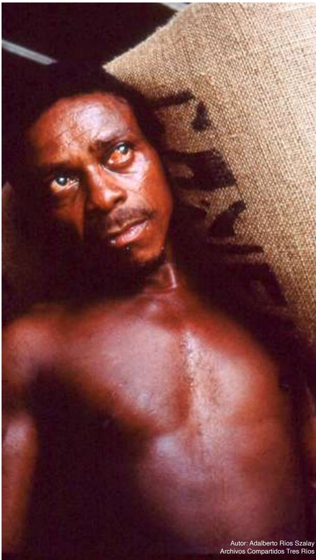
Autor: Adalberto Ríos Szalay Archivos Compartidos Tres Ríos