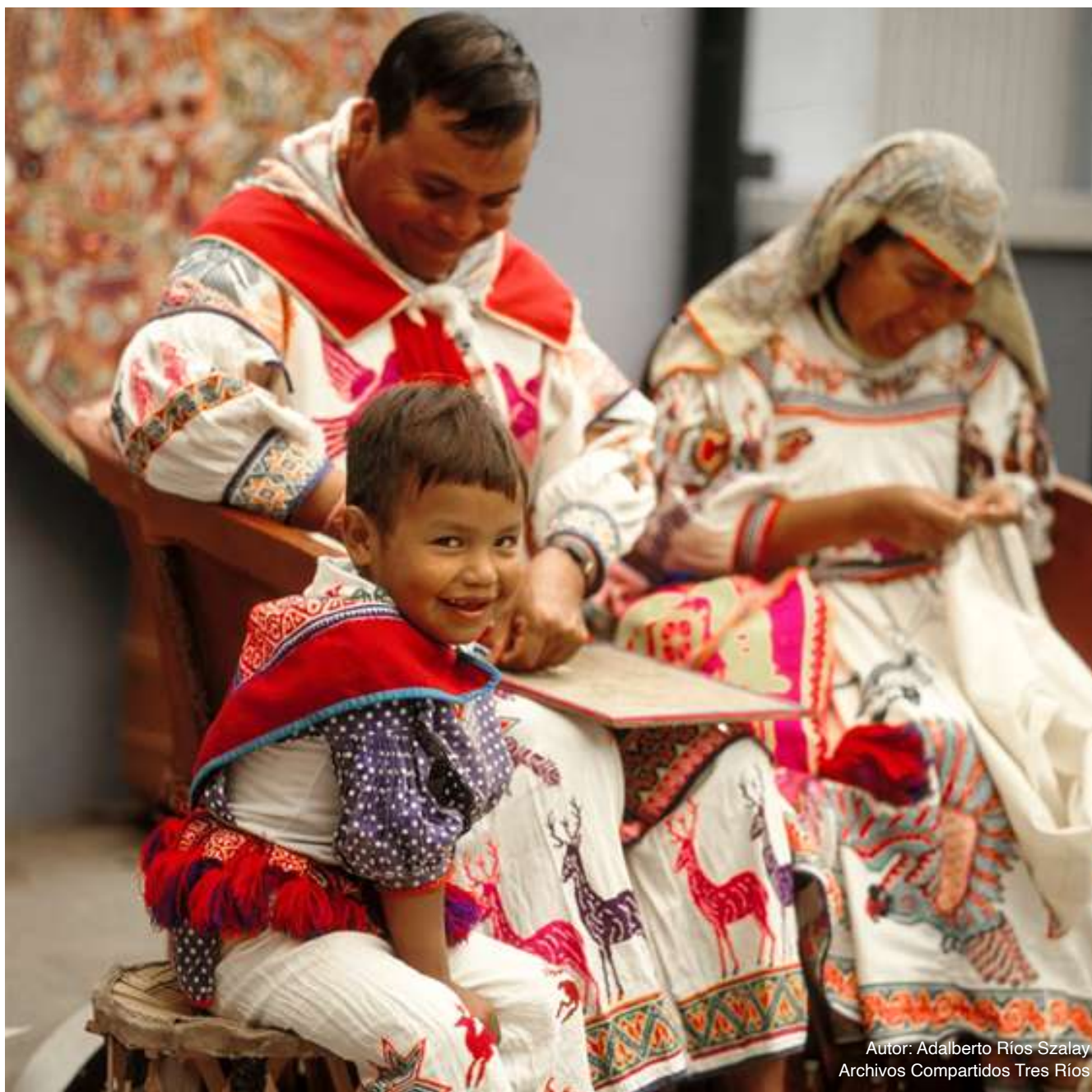
Autor: Adalberto Ríos Szalay Archivos Compartidos Tres Ríos